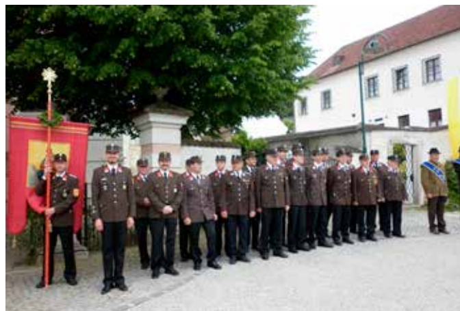
Fronleichnam: Abordnung der Feuerwehr am Kirchenplatz