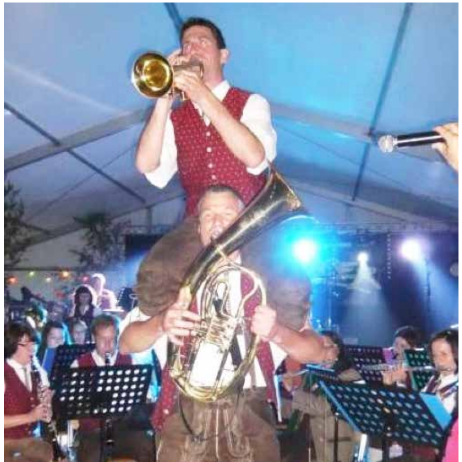
Weißenkirchner-Treffen in Weißkirchen in der Steiermark