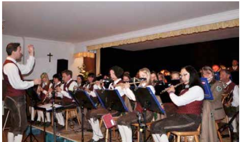
Konzert „Made in Austria“