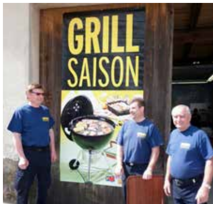
2013: Erstes Feuerwehrfest im neuen Feuerwehrhaus

Im Ich möchte Ihnen das Feuerwehrjahr 2013 von Murstetten etwas anders rückblenden und darstellen. Ein Bild sagt mehr als 1000 Worte – die Höhepunkte des Feuerwehr-Jahres 2013: