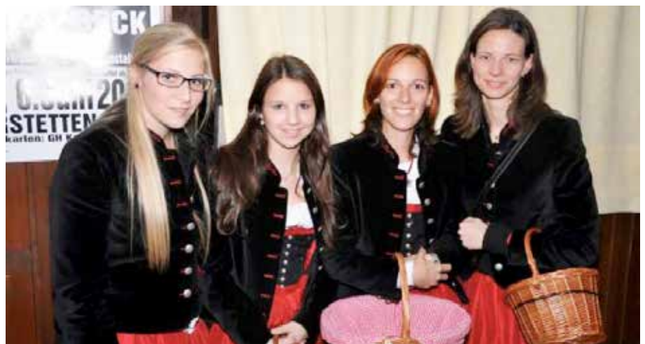
Konzert „Made in Austria“