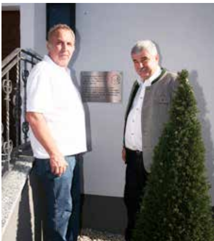
Gedenktafel an der Westfassade der Dorfkapelle: Renovierungsarbeiten im Rahmen des Familienwandertages abgeschlossen.