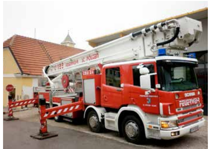
Sirenenumbau unter Mithilfe der Stadtfeuerwehr St. Pölten