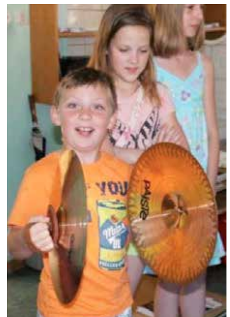
Probier- und Experimentiernachmittag