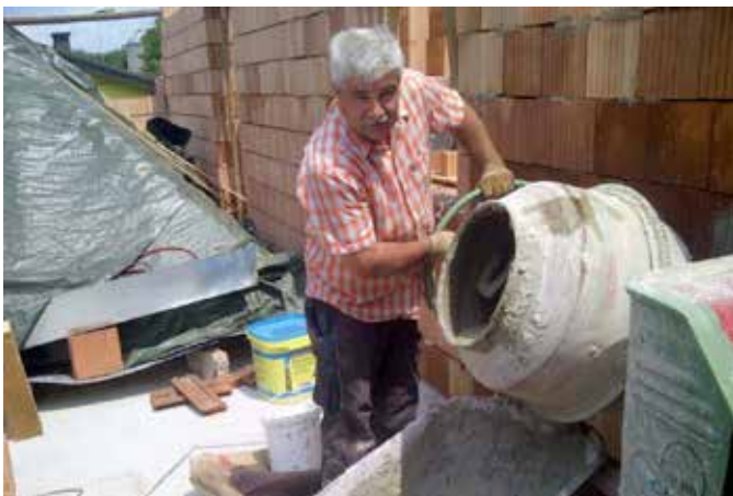
Der Umbau vom Musikheim