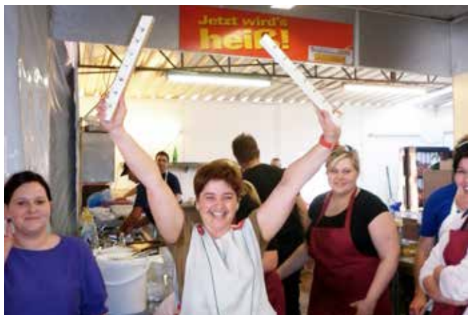
Sonntag, 15 Uhr: die letzte Bestellung am Feuerwehrfest