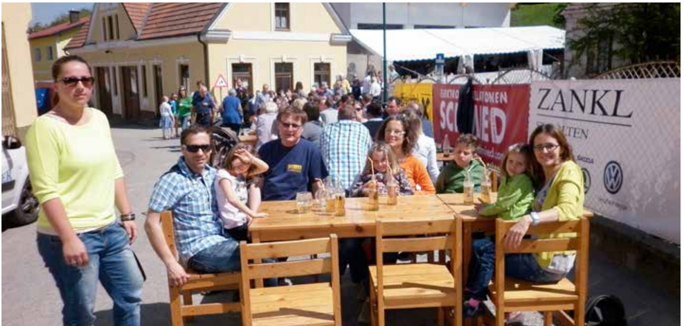
Weinkost 2013 mit sehr großem Andrang, sodass die Gäste auf der Straße untergebracht werden mussten.