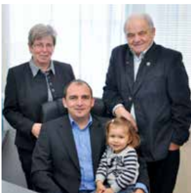
Ihr Partner rund ums Thema Versichern – Vorsorgen – Finanzieren

ADRESSE: BINDERGASSE 1 | 3142 LANGMANNERSDORF | TELEFON: 02784/2777 FAX: DW 4 MOBIL: 0660/8442777 BZW. 0664/5031331 | EMAIL: F.ERBER@AON.AT | WEB: WWW.VERSICHERUNGEN-ERBER.AT