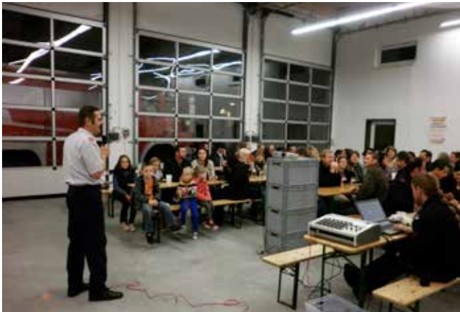
Feuerwehrfestabrechnung in der neuen Fahrzeughalle im September 2013