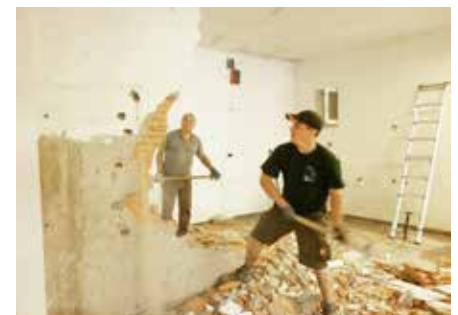
Insgesamt haben die Mitglieder der FF Murstetten für den Bau ihres neuen Feuerwehrhauses bereits über 1000 Arbeitsstunden geleistet.