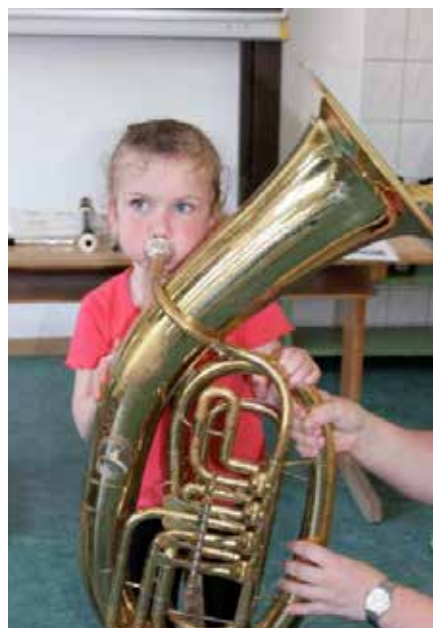
Probier- und Experimentiernachmittag