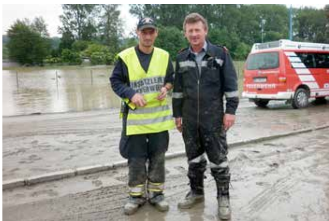
Hochwassereinsatz in Gottsdorf im Sommer 2013