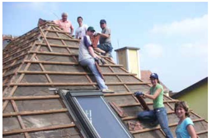
Der Umbau vom Musikheim