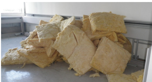
Künstliche Mineralfasern (KMF)