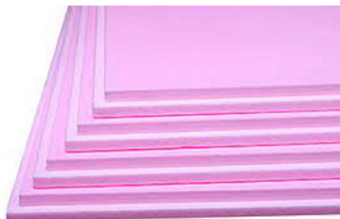
Extrudiertes Polystyrol (XPS)