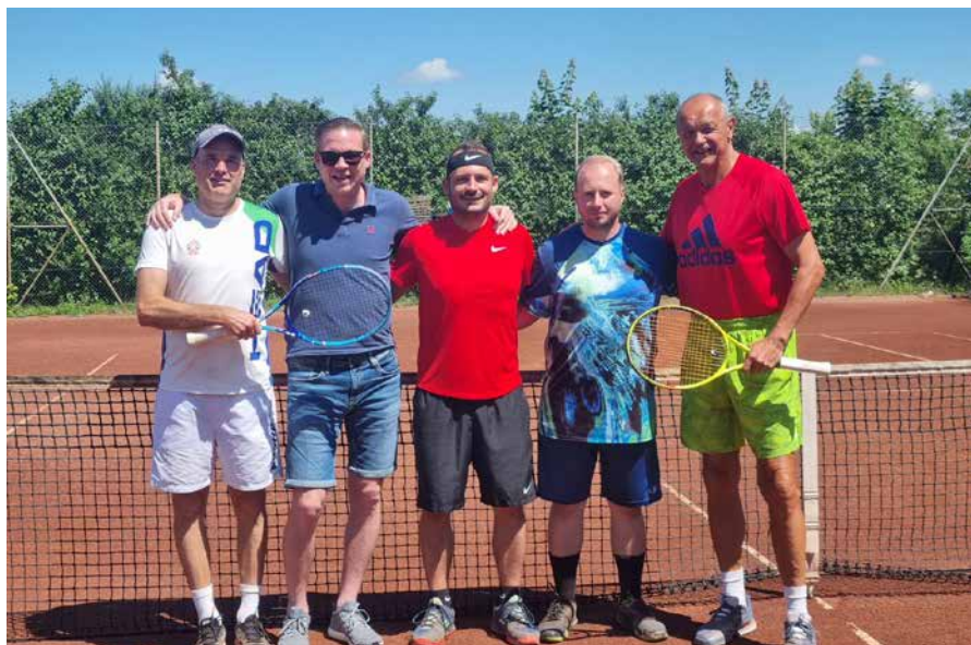
Ein Teil der Herrenmannschaft 1

Erstmalig geht der Wanderpokal in der allgemeinen Klasse nach Kapelln. So sicherte