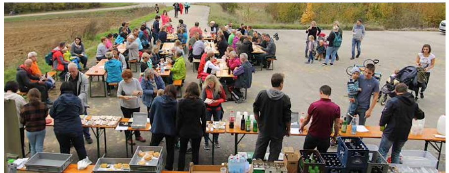
Labstube am Grunddorfer Berg

Am Freitag, 24. Juni 2022, luden die Ratscher und der Vorstand der Ortsgemeinschaft Perschling nach zweijähriger Pause wieder zum Sonnwendfeuer auf den Sportplatz in Perschling. Neben der traditionellen Bewirtung mit Speisen und Getränken gab es heuer erstmals auch eine vegetarische Variante, den „Vitusburger“, der auf Basis von Pilzen der „Schwammerlprinzen“ zubereitet worden war. Nach dem Hanselschießen der Ratscherkinder