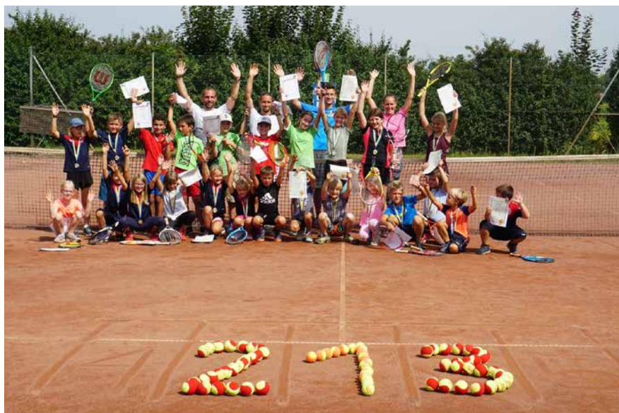
Meistermannschaft Herren 45+