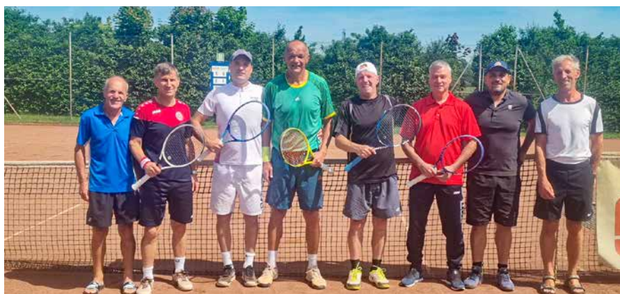
Meistermannschaft Herren 45+